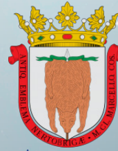
AYUNTAMIENTO DE RICLA