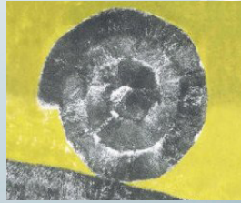
ASOCIACIÓN CULTURAL BAJO JALÓN

Presidente Asociación Cultural Bajo-Jalón